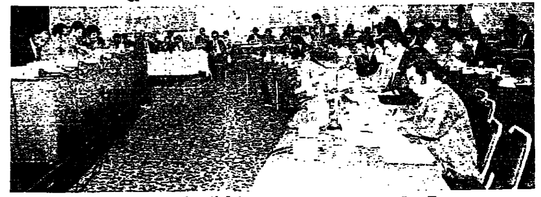
جانب من اجتماع اللجنة الاقتصادية لغربي آسيا

اختتمت امس، الدورة العادية الثانية للجنة الاقتصادية لغربي آسيا التي عقدت في جنيف «هولديان» بين 10 و11 أيار الجاري، وأصدرت تقريرا من سبعة فصول يحتوي على التوصيات التي توصلت إليها الدورة لرئاسة المجلس الاقتصادي والاجتماعي للأمم المتحدة لثبته. وتضمن الفصل الأول مشروع القرار والتقرير الذي تقدمه اللجنة عند دورتها العادية الثانية، والقرارات التي اتخذتها في الدورة، والموافقة على برنامج العمل والأولويات الواردة في التقرير المذكور. اما القرارات المرفوعة للمجلس الاقتصادي والاجتماعي للاطلاع عليها، فتتعلق بإشراك اللجنة في مجلس إدارة برنامج الأمم المتحدة للسلام، وإنشاء لجنة مرعية دائمة، وفقرت اللجنة عن الدول الأعضاء المهتمة باستضافة المقر الدائم للجنة، لتقديم الترحيبات الفعالة حول هذا الموضوع إلى اللجنة المستلمة. كما أشادت هذه القرارات بالجهود التي تبذلها في نيويورك، وإيداع ملاحظاتها وتوصياتها على الدول الأعضاء قبل بدء الدورة العادية لعام 1971، بسنة أسبوع على الأقل، تتشبا مع النظام الداخلي للجنة، ولتتمكن الدول الأعضاء من آليات في الموضوع. دعوة المجلس الاقتصادي والاجتماعي إلى التعاون، وكانت اللجنة قد قررت الدعوة إلى التعاون مع المؤسسات الإقليمية، وعند اجتماعات اللجنة فيلجسالات مجلس إدارة برنامج الأمم المتحدة للسلام، ويحث أركان إنشاء صندوق تمويل طوعي لتلبية طلبات الدول الأعضاء من الدراسات والخدمات الاستشارية ومعالجة الجهود لتقديم مزيد من الخدمات لصالح البلدان، الآتال إنماء في المنطقة، ومواصلة الاهتمام بسنة المرأة العاملة، وإصدار اللغة العربية الأصلية في التي تصاغ فيها جميع القرارات الصادرة عن اللجنة. كما أشادت هذه القرارات